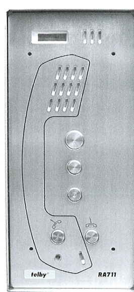
telby RA 711/1113