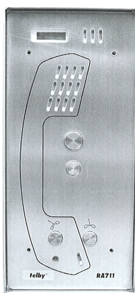
telby RA 711/1112