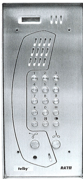
telby RA 711/1100

Les appareils de téléphone «Vandal Resist» robustes, montés sur une plaque métallique en acier inoxydable offrent une fonction mains libres avec haut-parleur. Du fait qu'aucune pièce externe ne peut être détruite, ces appareils se distinguent par une haute résistance contre le vandalisme de téléphone et assurent de ce fait la fonction primaire, c'est-à-dire l'établissement d'un appel, reste possible en tout temps. Le téléphone «Vandal Resist» a été conçu spécialement pour les besoins de clients exposés au vandalisme de téléphone. D'ailleurs il est particulièrement simple à installer et offre des solutions habiles contre les problèmes de montage variés à l'intérieur et l'extérieur de bâtiments, et en relation avec des applications industrielles.