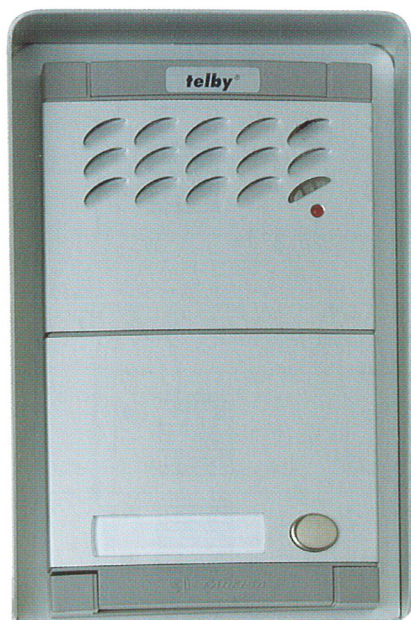
Forme Mody alu

Mini-téléphone de portail/ téléphones internes de la série telby 2000