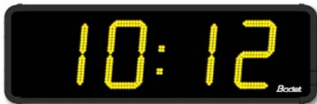
Anzeige: Stunden/Minuten – Datum – Temperatur